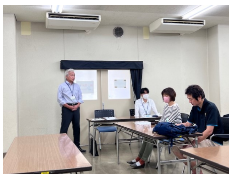
来賓ご挨拶（岡田係長）