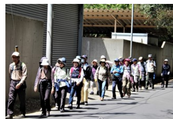
ウォーキング&ストレッチ