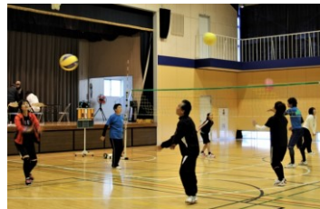
ソフトバレーボール