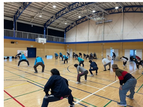
準備体操・ストレッチ 2