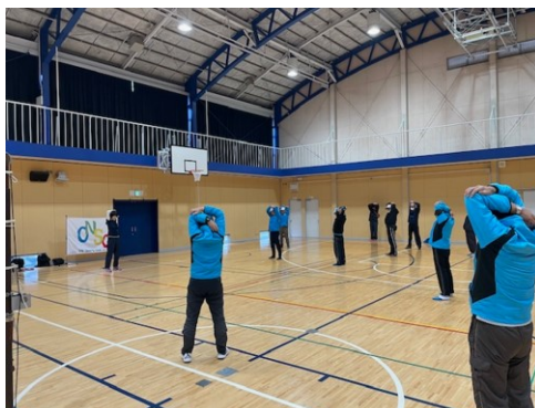
準備体操・ストレッチ 1