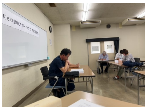
定期総会審議風景