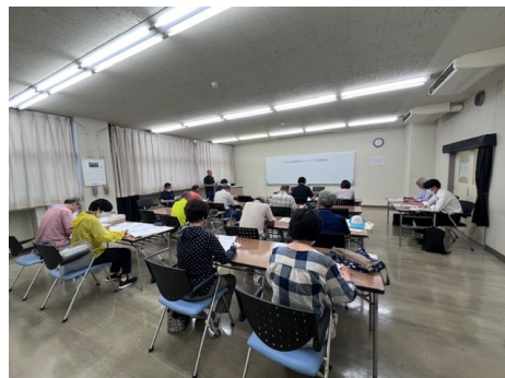
令和6年度定期総会

承認頂いた運営委員23名と事業計画に基づき、今年度のONスポーツクラブを運営してまいります。