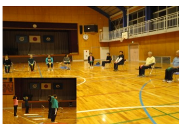
筋力トレ&ストレッチ