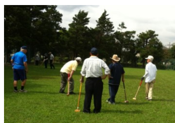
グラウンドゴルフ