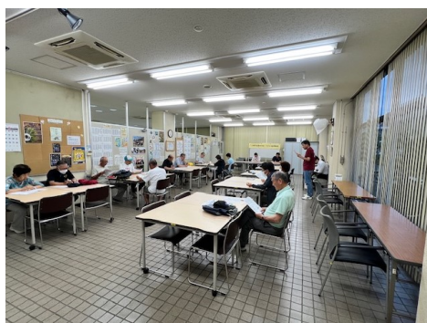
定時総会審議風景2