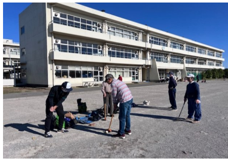
グラウンドゴルフ体験