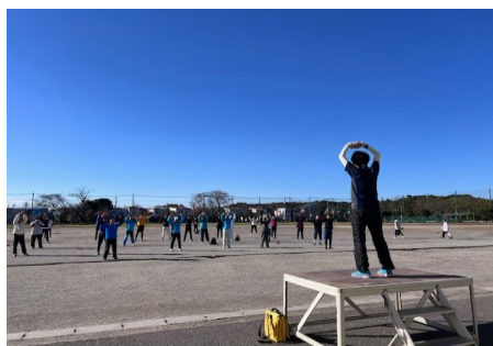
準備体操・ストレッチ

開催にあたっては、大山口中学校に多大な協力いただくと共に運営委員の綿密な事前準備と当日の大勢の方にお手伝いを頂き、無事に開催できました。2025年も10月又は11月でイベント開催を予定していますので、日程・内容が決まりましたらお知らせ致します。