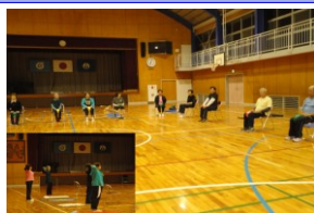
筋力トレ&ストレッチ