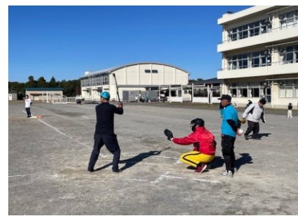
ソフトボール練習試合