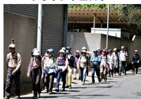
ウォーキング&ストレッチ