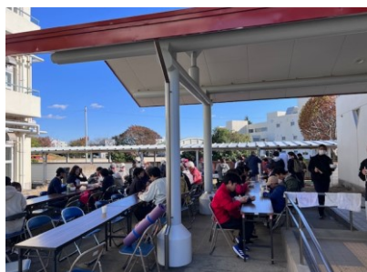
会員手作りの芋煮（昼食）