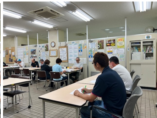
定時総会審議風景1